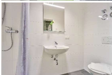
Abbildungen sind Beispiele, Ausstattung kann abweichen